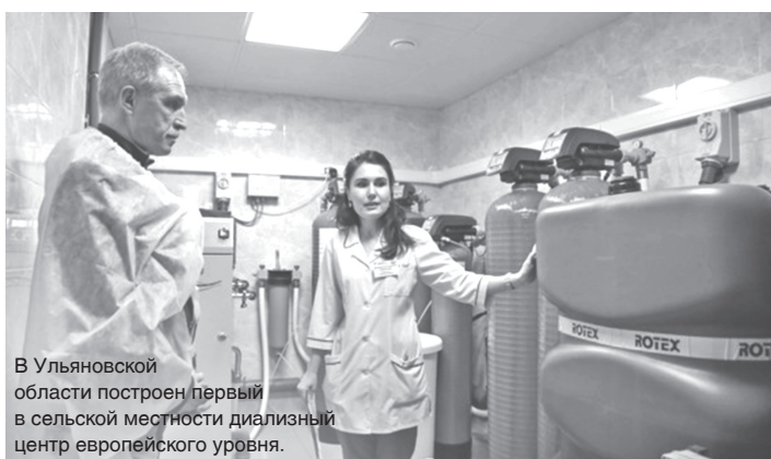
В Ульяновской области построен первый в сельской местности диализный центр европейского уровня.

Лечение пациентов в новом диализном центре в Николаевке будет осуществляться за счет средств обязательного медицинского страхования, - отметил заместитель председателя правительства - министр здравоохранения